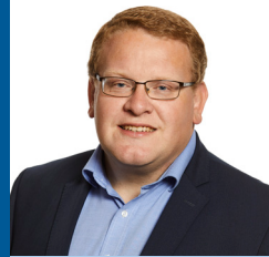
Bent Kloster O. Jerstal