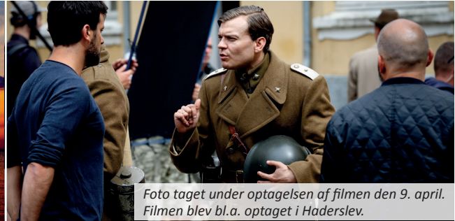
Foto taget under optagelsen af filmen den 9. april. Filmen blev bl.a. optaget i Haderslev.

Haderslev Kommune skal være det sted i vores landsdel, hvor folk vil bo, leve og arbejde.